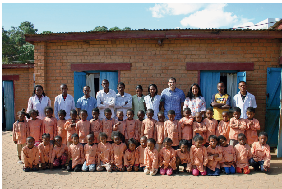
Le personnel et les 60 enfants d'A Bonne Ecole avant l'extension ABE Tananarive

deux projets pour offrir un avenir meilleur aux enfants en âge préscolaire